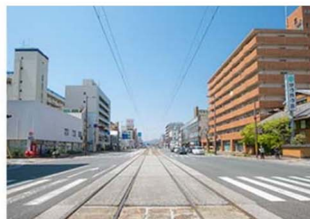
「かつれつ亭」さんの対面に当校がございます。