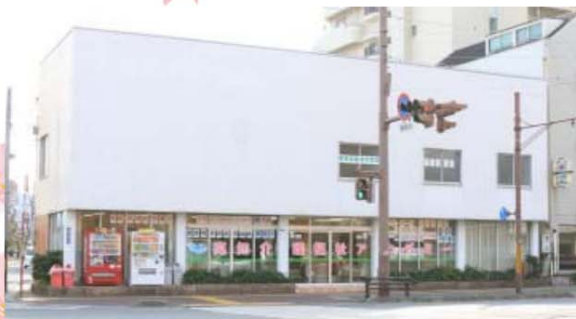
当校の入り口です。 裏に自転車・バイク用の駐輪場がございます。

お車でご来校の方は、誠に申し訳ございませんが近隣駐車場をご利用ください。 自転車・バイクの方は建物裏側にあります駐輪場をご利用いただけます。