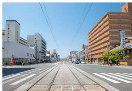
「かつれつ亭」さんの対面に当校がございます。