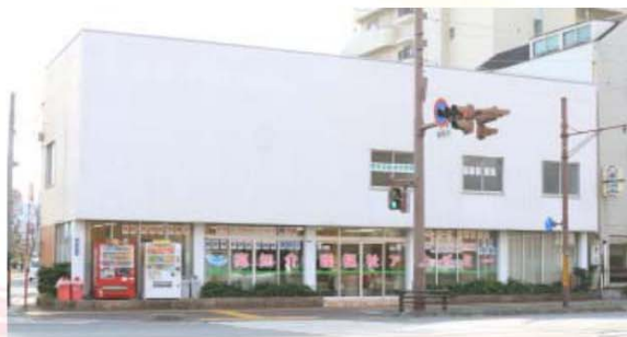
当校の入り口です。 裏に自転車・バイク用の駐輪場がございます。

お車でご来校の方は、誠に申し訳ございませんが近隣駐車場をご利用ください。 自転車・バイクの方は建物裏側にあります駐輪場をご利用いただけます。